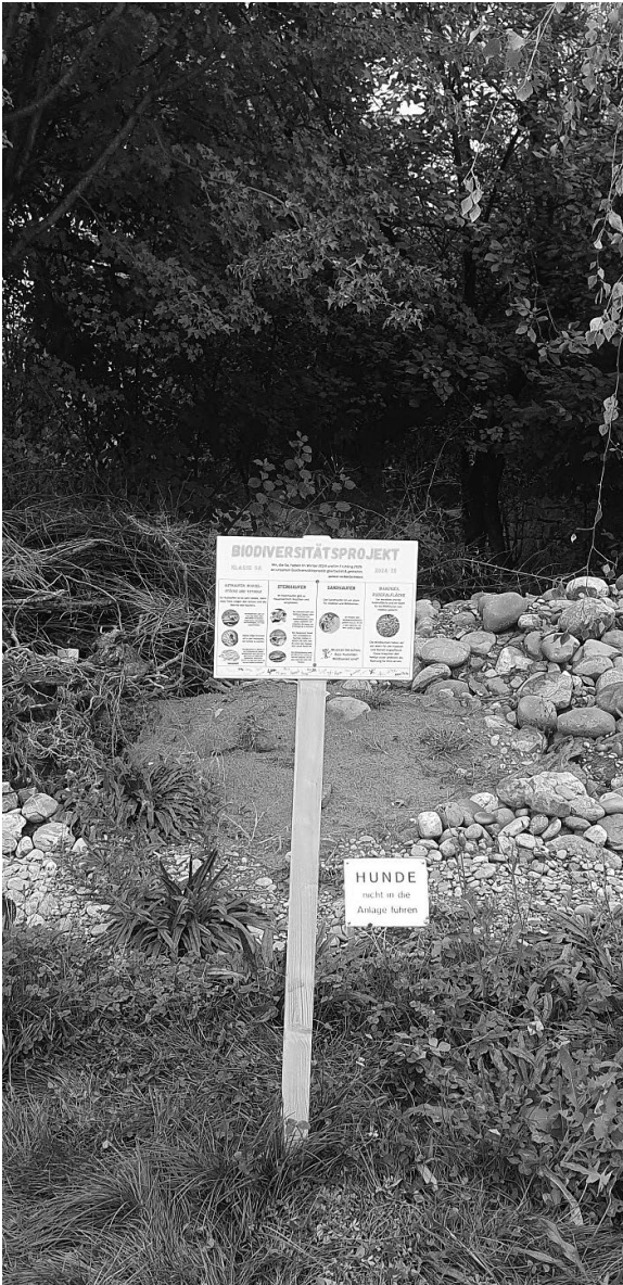
Informationstafel: Auf die Biodiversität aufmerksam machen.