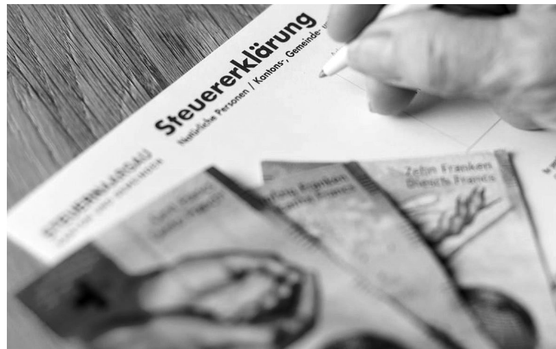
Steuererklärung: Und dann kommt die Rechnung.

Es ist hilfreich, die Bezahlung der Steuern bereits bei Erhalt der prov. Rechnung zu planen. Benötigen Sie Hilfe, finden Sie im Internet unter budgetberatung.ch Tabellen und Anleitungen zur Erstellung eines Budgets.