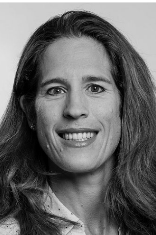
Rea Erne Gemeinderätin