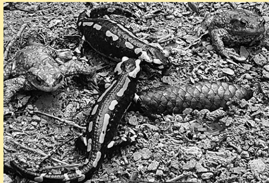
Salamander unterwegs: Bitte um Vorsicht.

Der Werkdienst beobachtet die Wettervorhersagen derzeit sehr genau – ausnahmsweise nicht wegen des Winterdienstes, sondern wegen der bevorstehenden Laichwanderungen der Amphibien. Auch in Ennetbaden machen sich nach dem Winter Frösche, Kröten, Molche und eine grosse Anzahl Feuersalamander auf den Weg zu Bächen, Flüssen und Stillgewässern, um dort ihren Laich oder lebende Larven abzulegen. Aus diesem Grund wird bereits zum vierten Mal eine mobile Zugstelle eingerichtet, um die Tiere oberhalb des Restaurants Hertenstein sicher über die Strasse zu führen. So bitten wir alle Verkehrsteilnehmerinnen und Verkehrsteilnehmer: