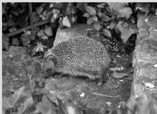
Igelhaus, Igel im Garten: Schutz vor Feinden, Regen und Kälte.