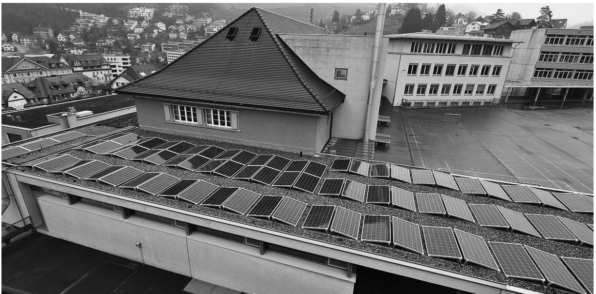
Photovoltaikanlage auf dem Foyer-Dach vor der Turnhalle: Kreislaufwirtschaft funktioniert auch beim Bau von PV-Anlagen.

Die regionale Wertschöpfung bei diesem Projekt war der Kommission ein zentrales Anliegen, weshalb die Anlagen unter Einbezug von