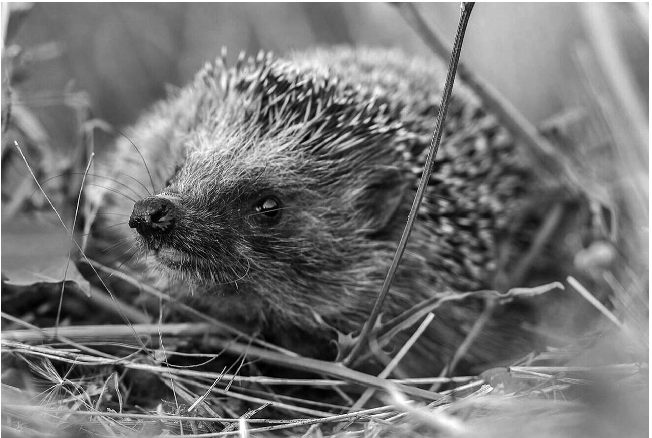
Der Igel als «Tier des Jahres» 2026: Auch in Ennetbaden zu Hause, aber gefährdet (Seite 10).

Das Informationsblatt der Gemeinde Ennetbaden