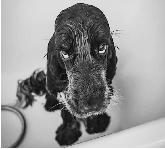
Skeptischer Blick: Auch Hunde werden digitalisiert.