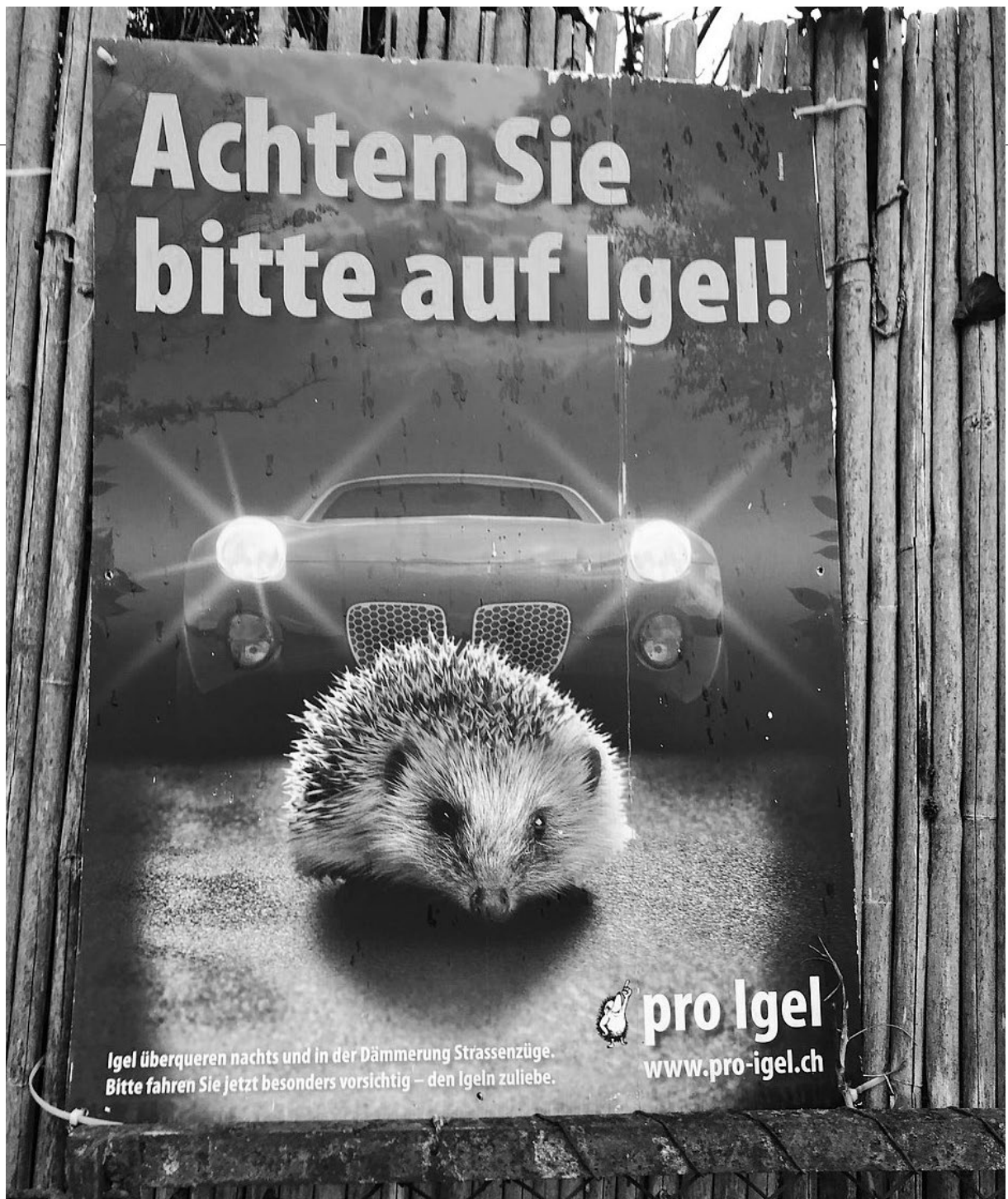
Plakat zum Schutz der Igel: Der Mensch als Hauptfeind.

Herausforderungen helfen. Genau dazu stachelt er uns als Tier des Jahres 2026 an.» (s. Box Seite 11)