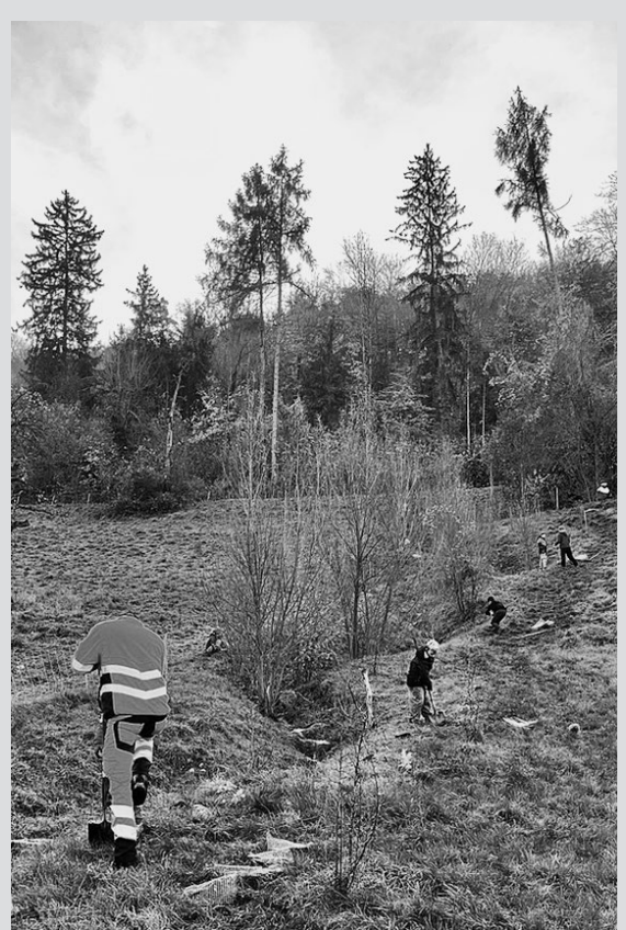
Ennetbadener Schülerinnen und Schüler beim Pflanzen von Hecken: Wertvolle Lebensräume.

Noch im vergangenen Jahr hat die Schulklasse 4a am Munibach eine neue Wildhecke gepflanzt. Die 15 Schülerinnen und Schüler pflanzten insgesamt 90 einheimische Sträucher aus zehn verschiedenen Arten. Jedes Kind setzte dabei sechs Sträucher. Zum Schutz vor Wühlmäusen wurden unten Gitter angebracht, oben schützten Vorrichtungen die jungen Pflanzen vor dem Verbiss durch Rehe. In Zukunft sollen die Sträucher durch die Schülerinnen und Schüler regelmässig kontrolliert werden. Wildhecken sind ein wertvolles Element unserer Kulturlandschaft. Sie vernetzen Lebensräume, bieten Nahrung und Schutz für zahlreiche Tierarten (auch dem Igel) und dienen als wichtiger Überwinterungs- und Fortpflanzungsort. Zudem schützen sie vor Wind und Bodenerosion und bereichern das Landschaftsbild durch ihre Blütenpracht und später im Jahr mit den farbigen Herbstverfärbungen. In den letzten Jahrzehnten sind viele Hecken durch Bautätigkeit und intensive Landwirtschaft verschwunden, umso wichtiger sind neue Initiativen wie die Ennetbadener Pflanzaktion.