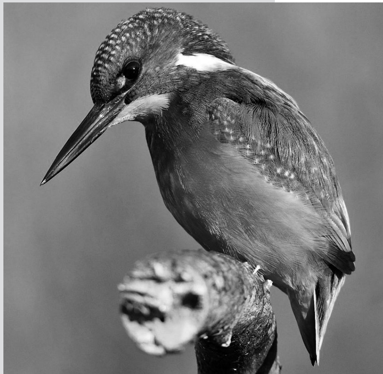
Eisvogel: Auch an der Limmat heimisch.

Birdlife Schweiz, die Naturschutzorganisation, die sich für den Schutz von Vögeln und ihren Lebensräumen einsetzt, hat den Eisvogel zum «Vogel des Jahres» 2026 erkoren. Der Eisvogel ist zwar auch an der Limmat heimisch. Aber am Limmatufer in Ennetbaden sind die Bedingungen für den scheuen farbigen Vogel mit dem charakteristisch langen Schnabel nicht ideal: Die Limmat fliesst hier zu schnell. Limmataufwärts bei der Neuenhofer Webermühle oder limmatabwärts am Kappisee sind die Voraussetzungen besser, und der Vogel wurde dort auch schon gesichtet. Er braucht klares Wasser, um seine Nahrung – kleine Fische – erspähen und dann mit einem raschen Tauchgang erbeuten zu können. Obwohl sich der Bestand an Brutpaaren in den letzten Jahren leicht erholt hat, gehört der Eisvogel noch immer zu den gefährdeten Vogelarten in der Schweiz. Der Eisvogel löst als «Vogel des Jahres» das Rotkehlchen ab. Dieses ist weit verbreiteter als sein Nachfolger – auch in unsern Gärten.