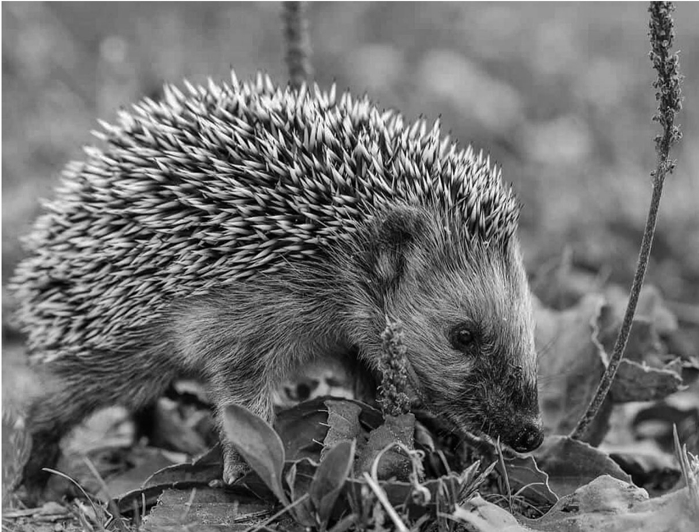
Igel im Garten: Je naturnäher, desto besser.