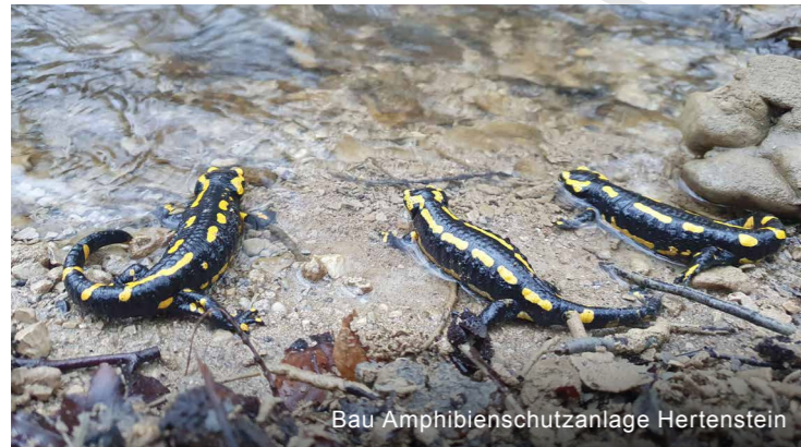
Bau Amphibienschutzanlage Hertenstein