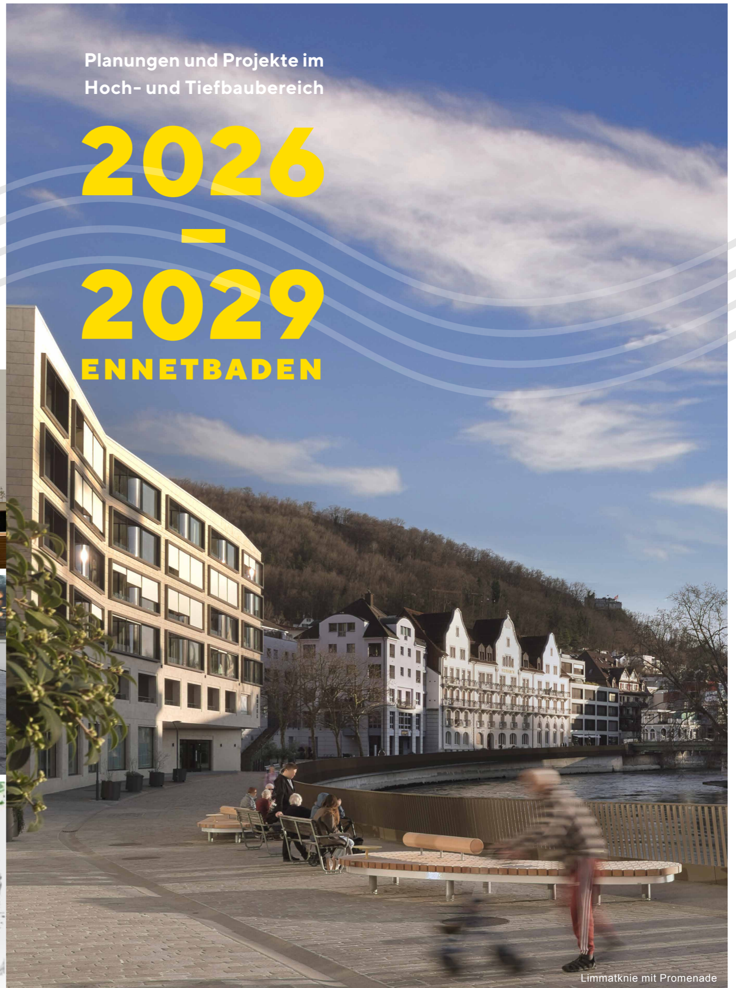
Limmatknie mit Promenade