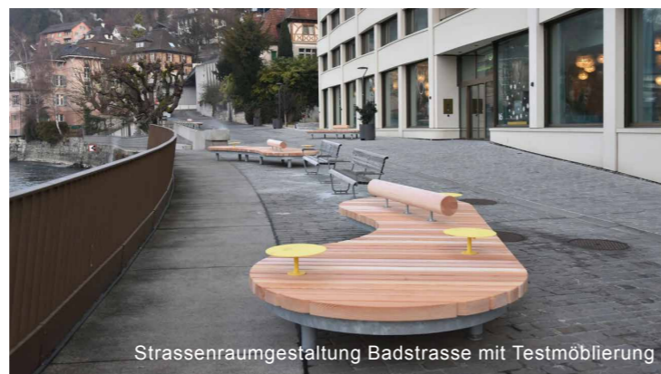
Strassenraumgestaltung Badstrasse mit Testmöblierung