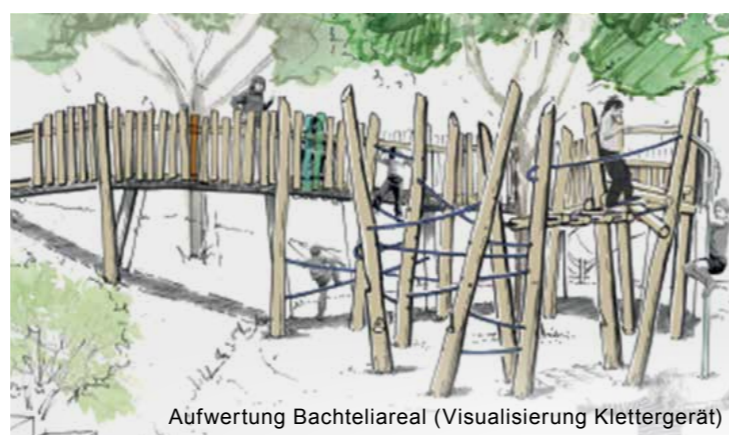
Aufwertung Bachteliareal (Visualisierung Klettergerät)