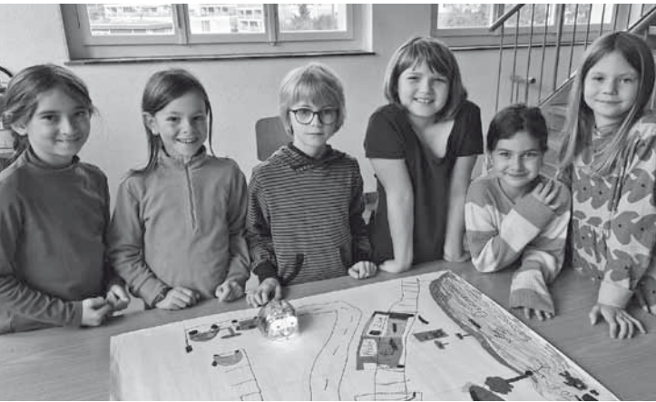
Ennetbadener Schülerinnen und Schüler mit einem Kleinroboter: «Den Kindern etwas zugetraut.»