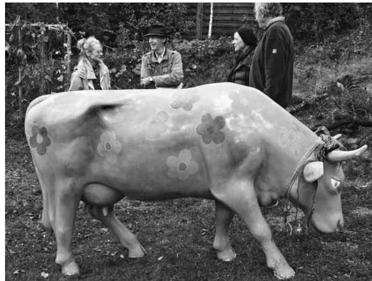
Zürcher Kuh Flora: Auf der Oberen Alp eine neue Heimat gefunden.