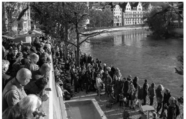
Einweihung des Heissen Brunnen: Was lange währt...