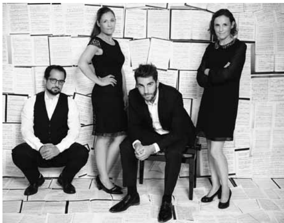
Das Ensemble «orion vokal 4»: Weihnachtslieder und Bach.