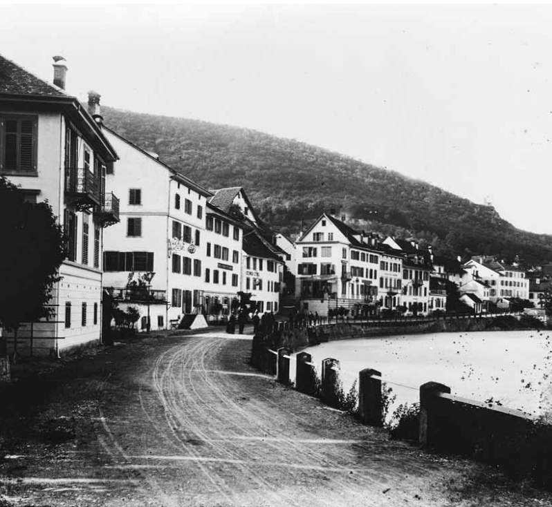
Badstrasse um 1890: Ein Hauch von mondänem Kurleben während der Belle Époque.

Mit dem bürgerlichen Zeitalter , das zu Beginn des 19. Jahrhunderts anhub, wurden die Sitten strenger. Das öffentliche Bad gehörte zwar noch eine Zeit lang dem unkultivierten Pöbel. Wer aber etwas auf sich hielt, badete in Privatbädern. Solche Privatbäder kamen im 19. Jahrhundert immer mehr in Mode. Anfang des 19. Jahrhunderts gibt es in Ennetbaden neben den zwei öffentlichen Badehäusern erst zwei private Bäder. Das ändert sich um 1810, als die Hoteliers die Erlaubnis bekommen, Bäder einzurichten.