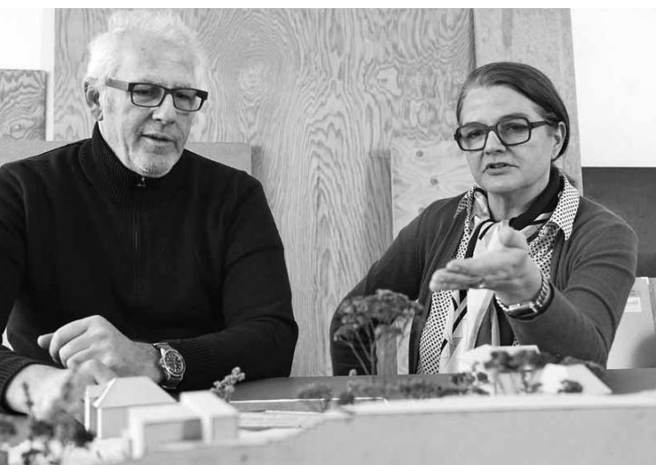
Haus Alder in Zürich, Architekten Fuhrmann, Hächler: Stimmige Form.