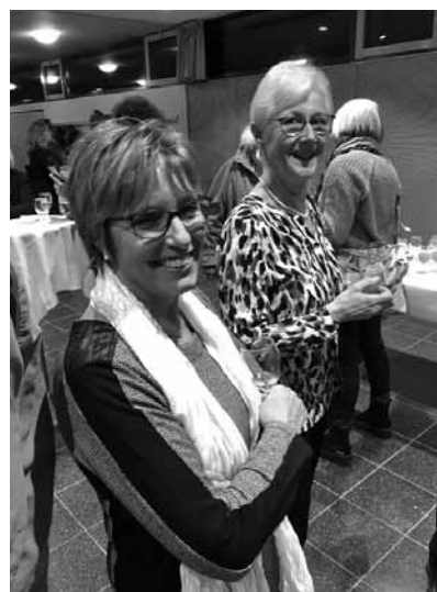
Beisammensein der Ennetbadener Behörden und Kommissionen: Dank für zum Teil jahrelanges Engagement.