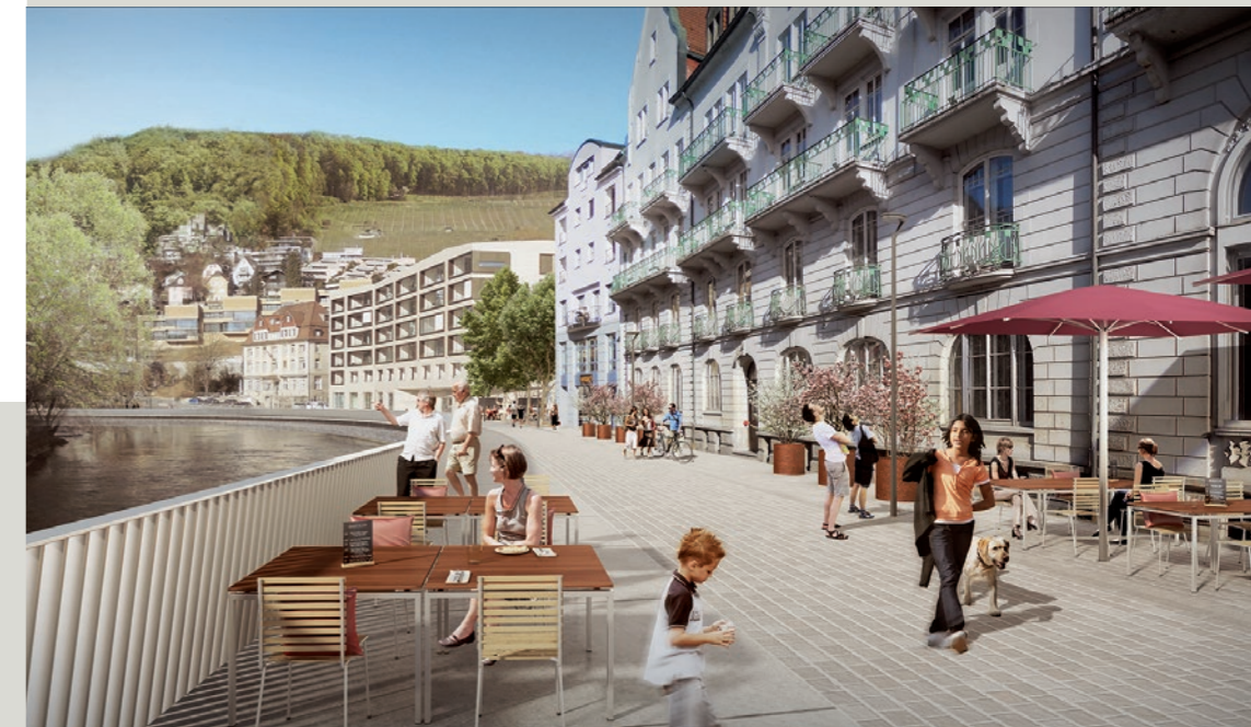
Visualisierung Gestaltung Badstrasse (F)