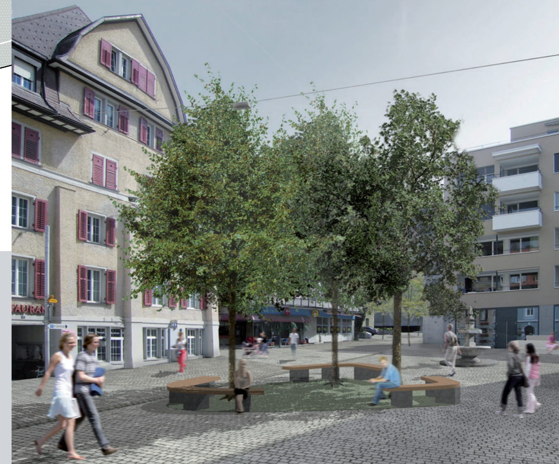
Postplatz, Visualisierung (G)