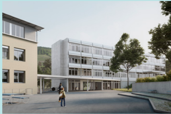
Visualisierung Schulhaus Bachtal (Südsicht)