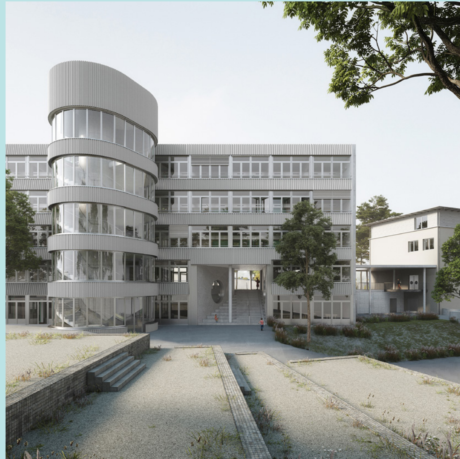
Visualisierung Schulhaus Bachtal