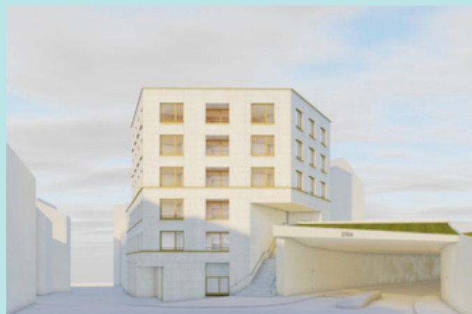
Überbauung Sonnenberg 7/9